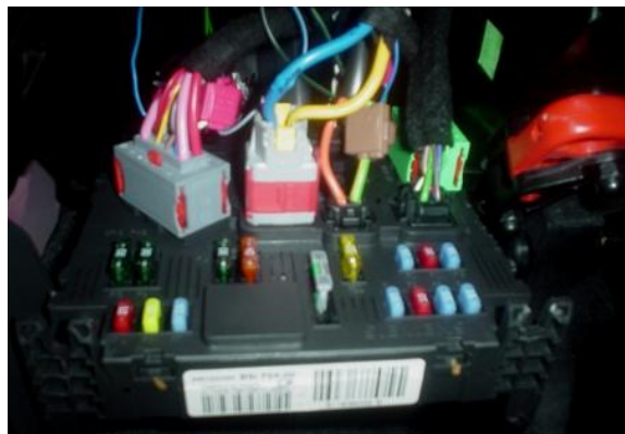
VISTA DA CAIXA DE FUSIVEIS (CSI) DE FRENTE

Este informativo tem o objetivo de esclarecer dúvidas referentes à aplicação do alarme keyless no Peugeot 207