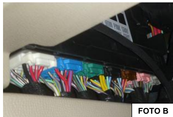
Central localizada atrás do puxador de capô

Conecte o fio vermelho do alarme (+ 12 Volts) , ao fio vermelho/violeta (grosso) na caixa de fusíveis, conforme foto A;